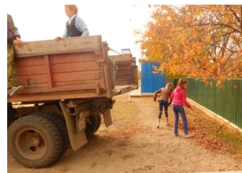
Уборка территории школы